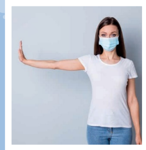
mbaj distancën e sigurisë