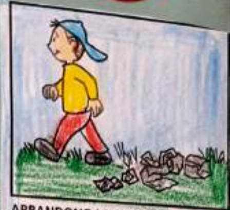
ABBANDONO LE CARTACCE SUL PRATO