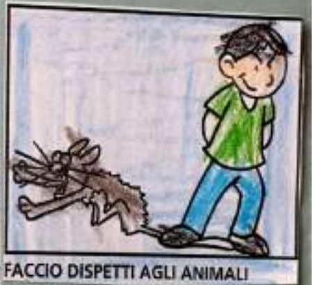
FACCIO DISPETTI AGLI ANIMALI