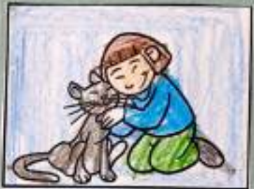
RISPETTO GLI ANIMALI