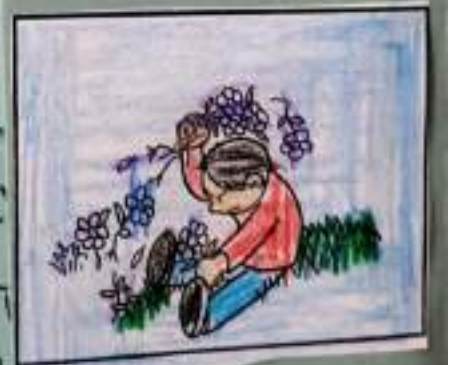
STRAPPO I FIORI

SE OGNI SPRECO E IL NOSTRO AMBIENTE AIUTEREMO !!