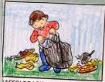
RACCOLGO I RIFIUTI DOPO IL PIC-NIC

Ci prendiamo cura del nostro pianeta se: