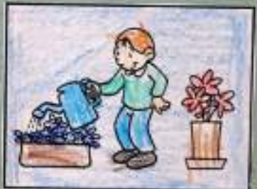
INNAFFIO I FIORI

È INUTILE PER L'UOMO CONQUISTARE LA LUNA, SE POI FINISCE PER PERDERE LA TERRA!